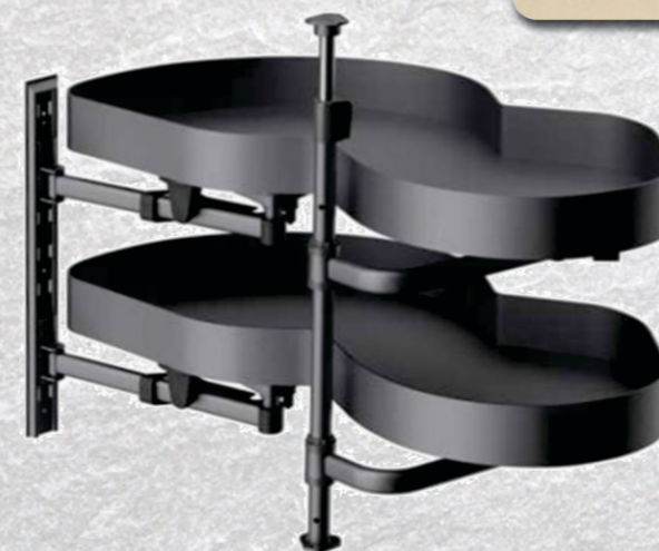
PKM900D - Peanut kotni mehanizem, za element 900 mm, DESNI, temno siva PKM900L - Peanut kotni mehanizem, za element 900 mm, LEVI, temno siva